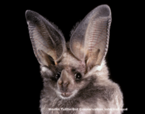
Mexican Tuttle Bat Conservation International