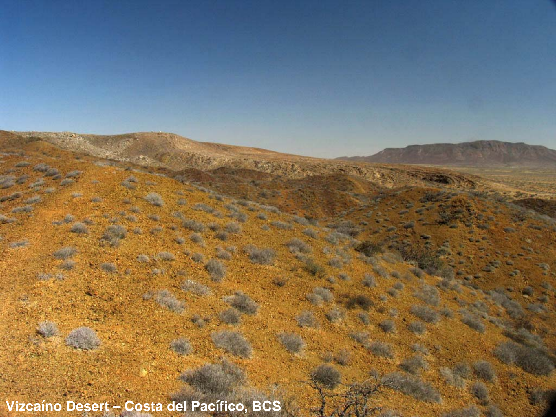
Vizcaíno Desert – Costa del Pacífico, BCS