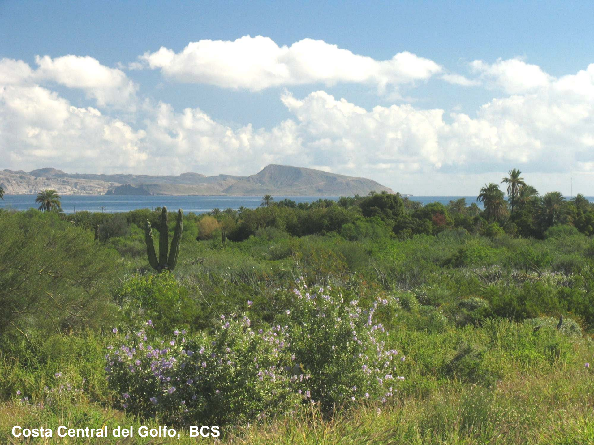
Costa Central del Golfo, BCS