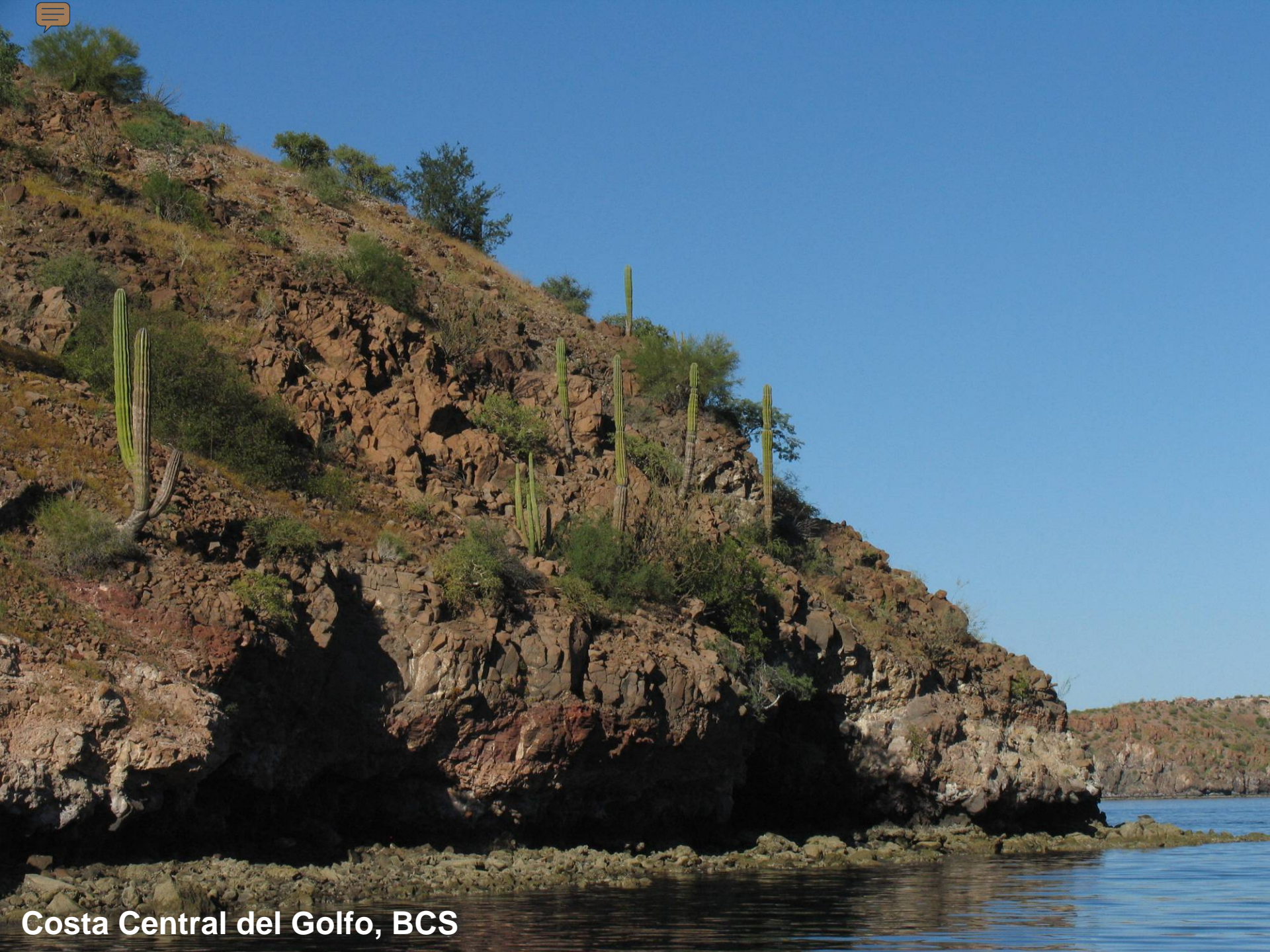
Costa Central del Golfo, BCS