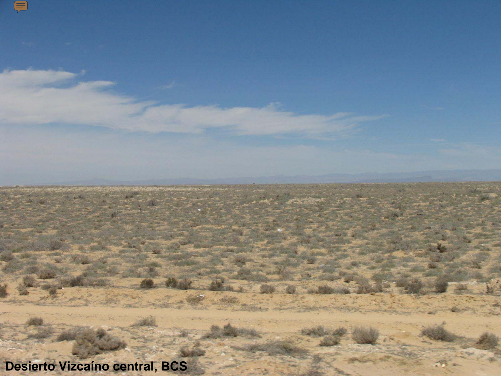
Desierto Vizcaíno central, BCS