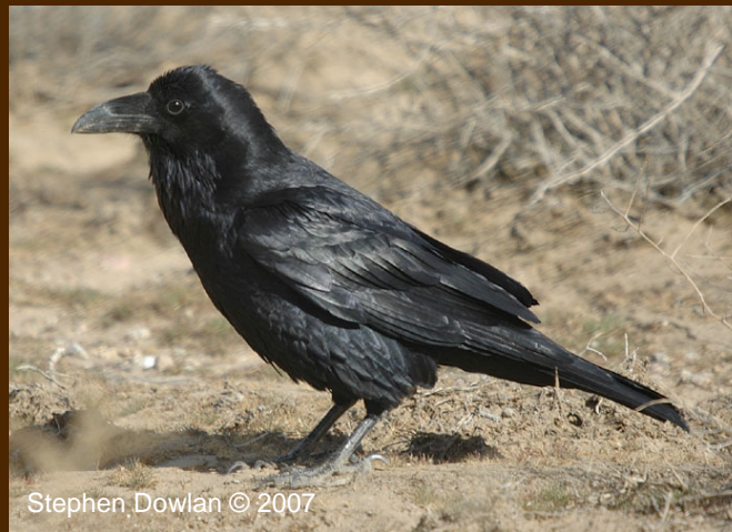
Stephen Dowlan © 2007