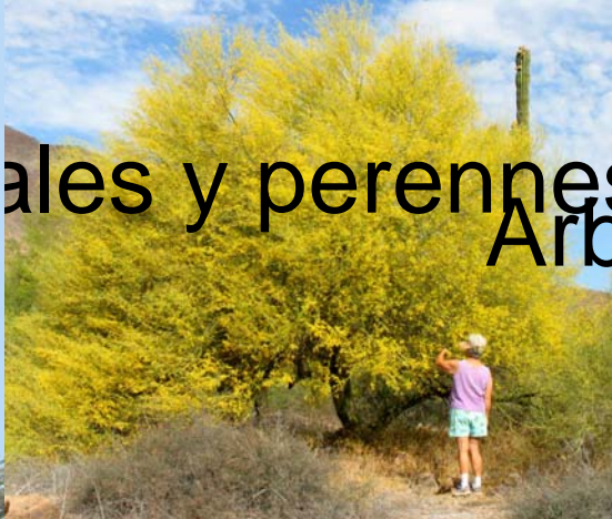
Arboles y perennes