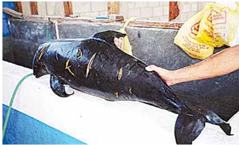
Se estiman que no quedan más de 250 ejemplares de la vaquita marina.

La red selectiva RS-INE-MX conocida entre los pescadores del Alto Golfo como “chango ecológico” asemeja a una pequeña red de arrastre