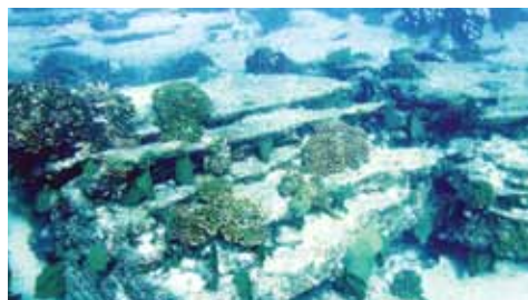
En 2005 Cabo Pulmo fue integrado a la lista de Patrimonio Natural de la Humanidad por la UNESCO y en 2008 a la lista del Convenio RAMSAR para la Conservación de Humedales de Importancia Internacional. (www.cabopulmovivo.org)

"El proyecto Cabo Cortés no se debe realizar, ya que presentó una serie de argumentos seriamente equivocados sobre los datos técnicos, que pone en riesgo la vida marina del arrecife de Cabo Pulmo. De manera omisa, el director general de impacto y riesgo ambiental prefirió ignorar la recomendación de sus colegas dentro