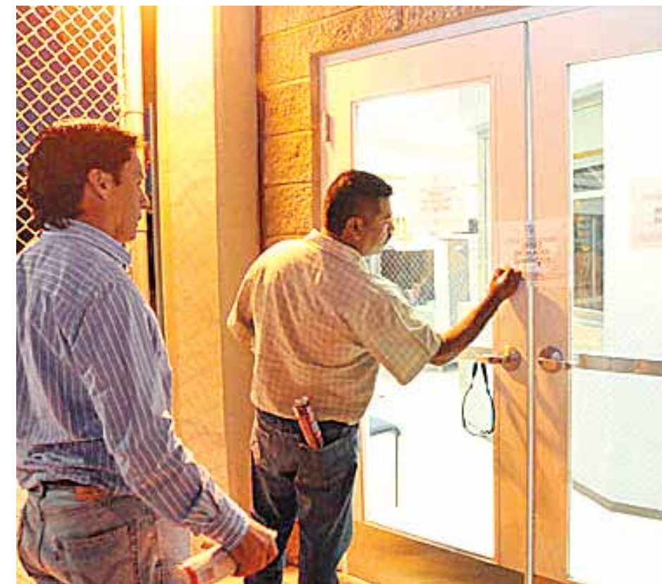
Personal del Ayuntamiento de Ensenada observan la clausura temporal de Sempra Energy.