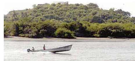
A pesar de las amenazas de muerte en su contra las personas integrantes de El Movimiento Mexicano de Afectados por las Represas (MAPDER), siguen abandonando la defensa de los derechos humanos.