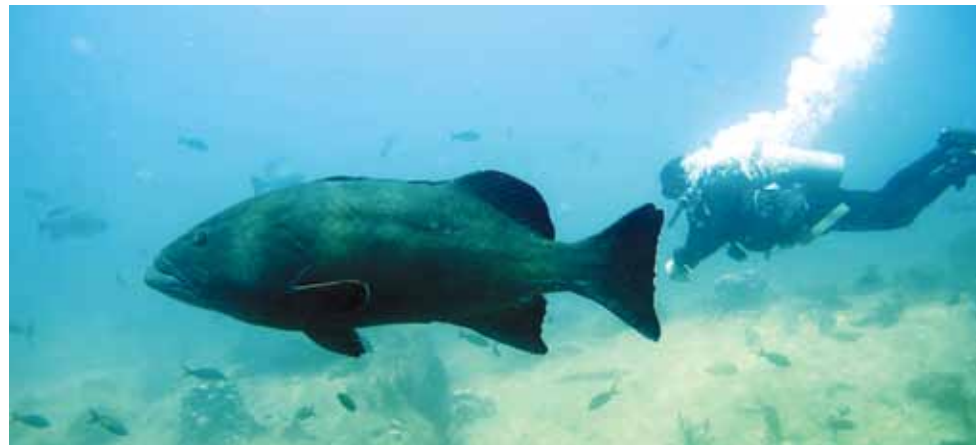
Cabo Pulmo es un ejemplo de los beneficios ecológicos y económicos que brindan los ecosistemas saludables, convirtiéndose en uno de los principales puntos de buceo en el Pacífico mexicano y en un importante receptor de turismo de naturaleza en el estado. (www.cabopulmovivo.org)