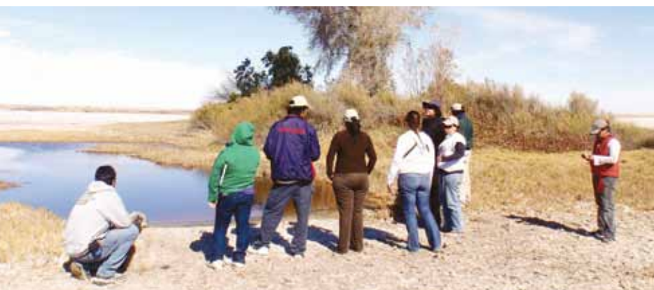
Realizaron práctica de campo durante la capacitación.

Viaja libre al igual que el rayo de luz, deleitándose en la distancia, posándose en las llanuras salitrosas de lo que antes fuera el majestuoso y extenso Delta del Río Colorado. Según el historiador Leo Hillar, en 1540 Fernando de Alarcón fue el primer explorador Europeo en navegar por las caudalosas aguas, del mismo, llegando