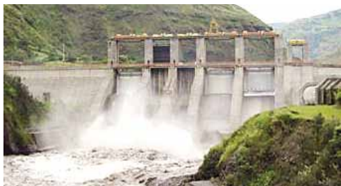
El gobierno federal planea construir la hidroeléctrica Las Cruces en territorio nayarita.