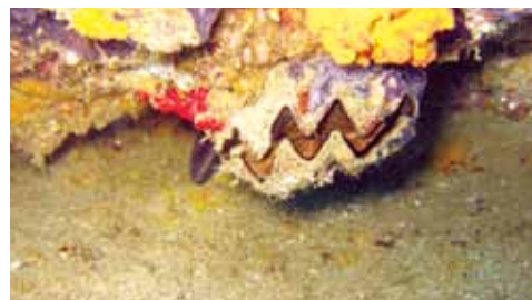
De construirse Cabo Cortés, el daño al arrecife significaría la pérdida de un sitio importante para la migración de especies marinas que han retornado a la zona.

No menos de 22 científicos de 18 instituciones académicas nacionales e internacionales exhortaron a la Unesco para que solicite al gobierno mexicano que rechace el mega proyecto, mediante una misiva que se puede consultar en