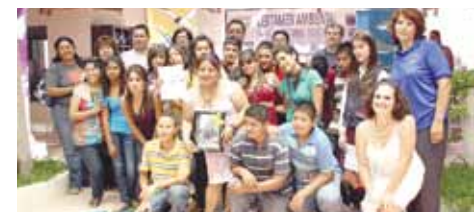
Los finalistas festejaron la ceremonia de premiación en el marco del Día Mundial del Medio Ambiente y del Día de los Océanos.

Puerto Peñasco, por primera vez contó con la participación de estudiantes de El Desemboque, Ejido Campodónico y Ejido Oribe de Alba en Sonora así como de San Felipe en Baja California. La ceremonia de premiación se llevó a cabo el pasado 11 de junio, en el marco del Día Mundial del Medio Ambiente y del Día de los Océanos.