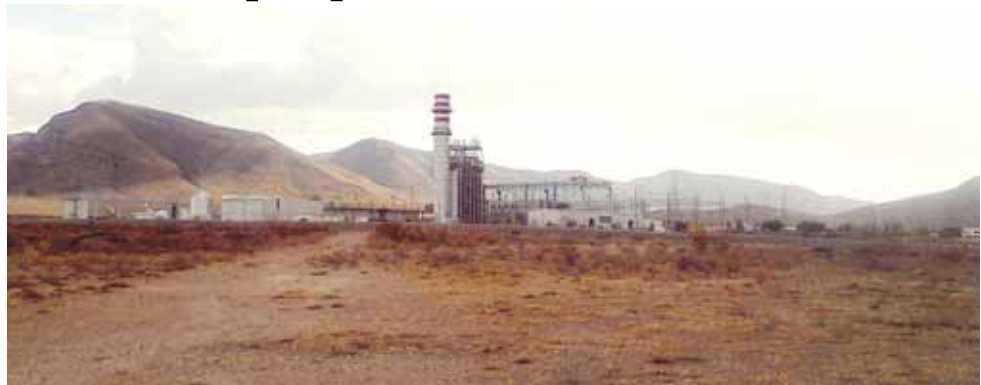
Abengoa trabaja en la central termoeléctrica de Agua Prieta II.

El campo solar es parte del plan de la CFE para contar con una central de ciclo combinado con un valor total de 642 millones de dólares, de los cua-