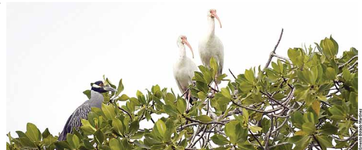
Entre los habitantes y migrantes del Puerto de Teacapán, se reconocen la importancia de varias especies.