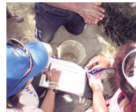
Estudiantes y maestros del Centro de Estudios Tecnológicos del Mar (CETMar 14) participaron en el Primer Taller de Monitoreo Biológico Comunitario.