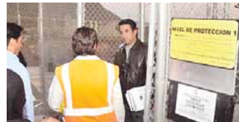
Personal del Ayuntamiento de Ensenada observan la clausura temporal de Sempra Energy.