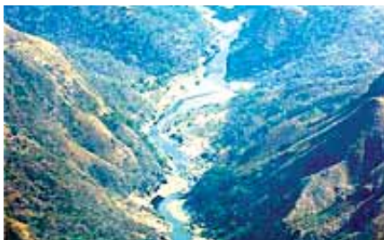
La construcción de la hidroeléctrica tendría graves efectos sobre el Río San Pedro, su vegetación y fauna.