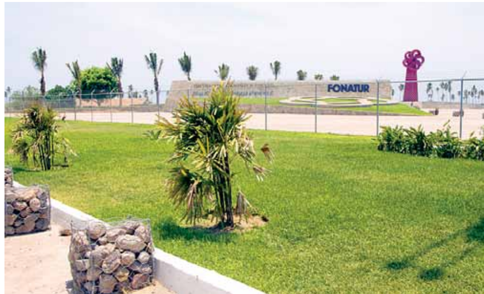
Las instalaciones del Fondo Nacional de Fomento al Turismo (Fonatur) son parte principal de la obra del Centro Integralmente Planeado (CIP) Costa Pacifico.

La Secretaría de Medio Ambiente y Recursos Naturales (Semarnat), a través de la Dirección General de Impacto y Riesgo Ambiental (DGIRA),