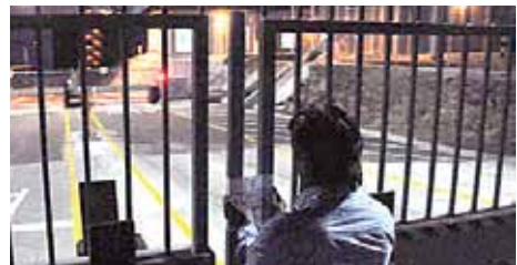
La carta del alcalde de Ensenada Enrique Pelayo Torres fue publicada en el portal www.ensenada.gob.mx