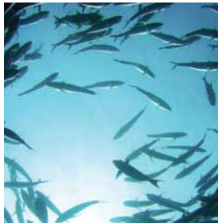
Recuperado de la sobrepesca, Cabo Pulmo es el área marina con mayor concentración de peces en todo el Golfo de California.