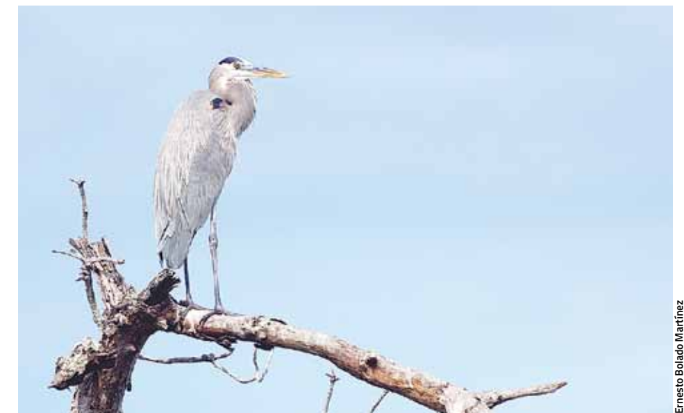
Entre los habitantes y migrantes del Puerto de Teacapán, se reconocen la importancia de varias especies.

Cabe mencionar que algunas optan por anidar en árboles de la comunidad, como pal-