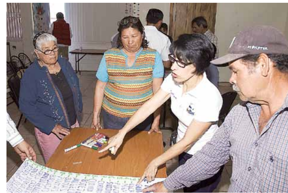
Acuden a mesa de trabajo durante Taller de Servicios Ambientales Costeros en Puerto Peñasco.