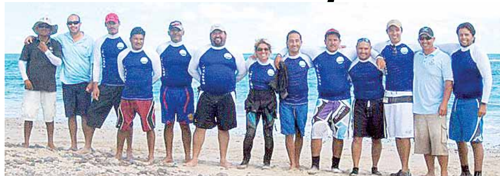
Cada una de los integrantes del grupo de Buzos Monitores de la Reserva de la Biósfera Isla San Pedro Mártir tiene un mínimo de 10 años de experiencia.

El proyecto de capacitación a pescadores empezó en el 2007, a cinco años de la formación de la Reserva de la Biósfera Isla San Pedro Mártir. Hoy a escasos cuatro años, los pescadores son reconocidos regionalmente por su aportación a la comunidad. Han aprendido mucho más de lo que cono-