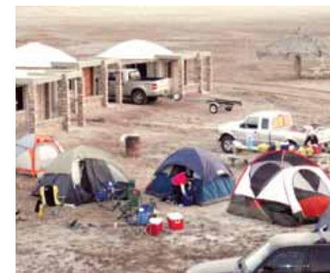
Instalaron campamento en la Ciénega Santa Clara.

*ALUMNA DEL CENTRO DE ESTUDIOS TECNOLÓGICOS DEL MAR (CETMAR) NO. 14