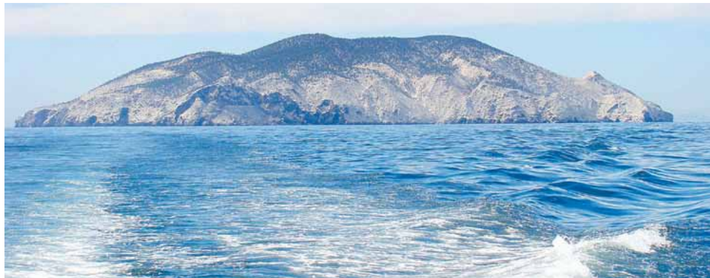
Los buzos retoman el nombre de su grupo de la Isla San Pedro Mártir, punto de referencia en la Bahía de Kino

Debido a que parte del poblado no muestra mucho interés en proteger sus recursos, “esperamos compartir a la comunidad nuestro conocimiento adquirido, como lo hemos estado haciendo con los clubes ecológicos: cuidar,