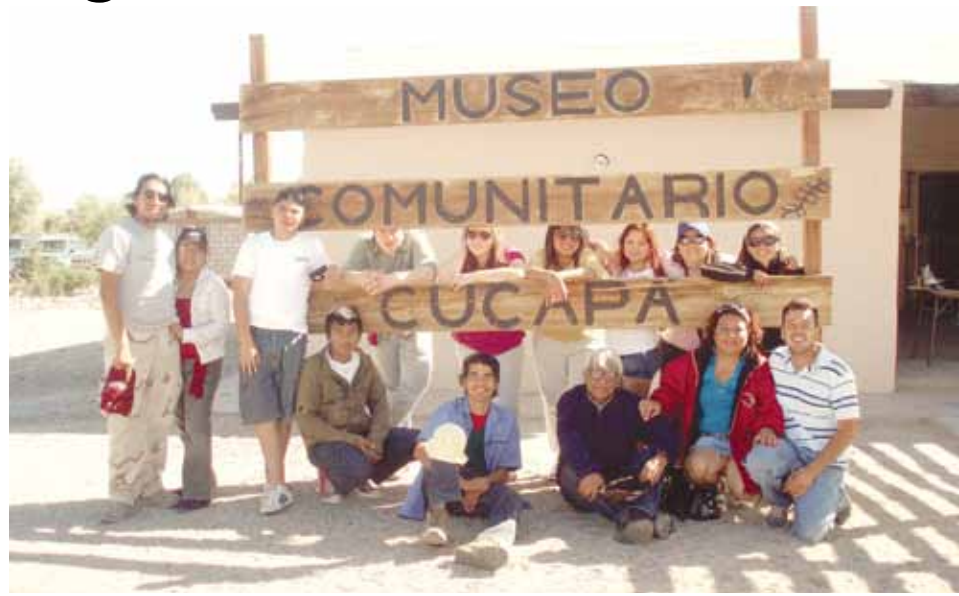
Alumnos del Centro de Estudios Tecnológicos del Mar (CETMar) No. 14, recibieron capacitación técnica sobre monitoreo de aves y peces.

Para llegar, se dirigieron por la carretera de San Felipe a Mexicali hasta el Km. 48 y el rancho, de donde se puede observar no solo el