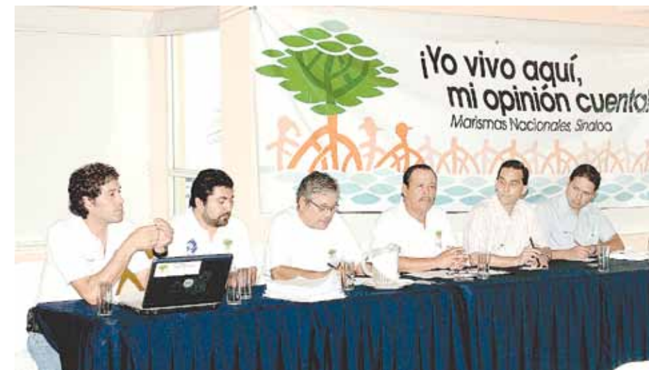
Voceros de la campaña ¡Yo vivo aquí, mi opinión cuenta! ofrecen rueda de prensa.

En el mismo febrero de 2009 cuando el Presidente Felipe Calderón anunció el proyecto turístico, la Alianza para la Sustentabilidad del Noroeste Costero Mexicano (Alcosta) hizo un llamado a las autoridades involucradas para que se rediseñara el proyecto, lo cual permitiera aprovechar las características únicas del sitio, su capital natural, cultural, arqueológico, y sobre todo se asegurara el beneficio de los habitantes locales y se evitara la construcción caótica, la falta de servicios